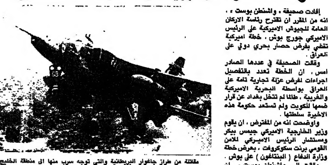
مقاتلة من طراز جنغاور البريطانية والتي توجه سرب منها الى منطقة الخليج